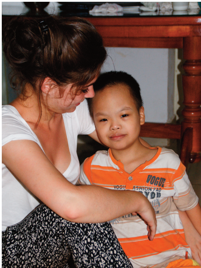
Le sourire accompagne toujours une belle rencontre

Donner l'envie d'apprendre quelques mots et expressions de la langue et se documenter sur les us et coutumes, préparer des activités «plan B» complètent le tableau ce qui permet