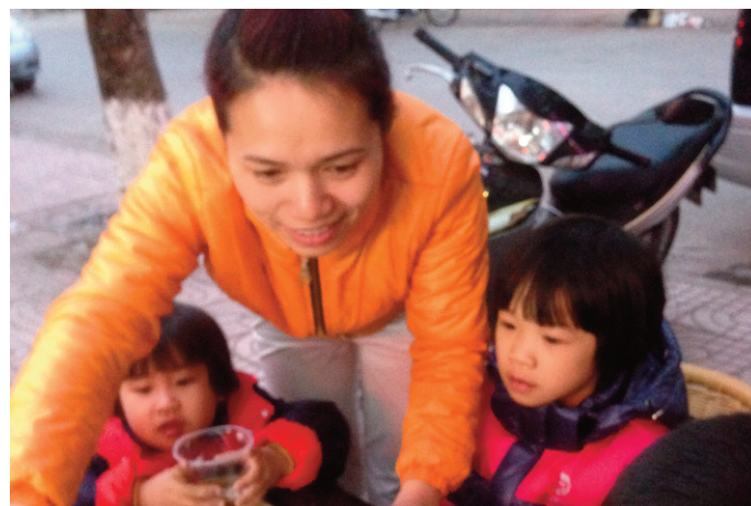
Une bonne fée pour ces enfants