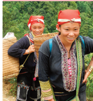
( costume femme Dao Rouge )

Si vous avez 2 heures de temps à donner n'hésitez pas à nous envoyer un mail. Cette expo nous est prêtée par l'association AFV amitié franco vietnamienne et sera organisée par EPVN dans le cadre des 40 ans des accords de Paix entre la France et le Vietnam